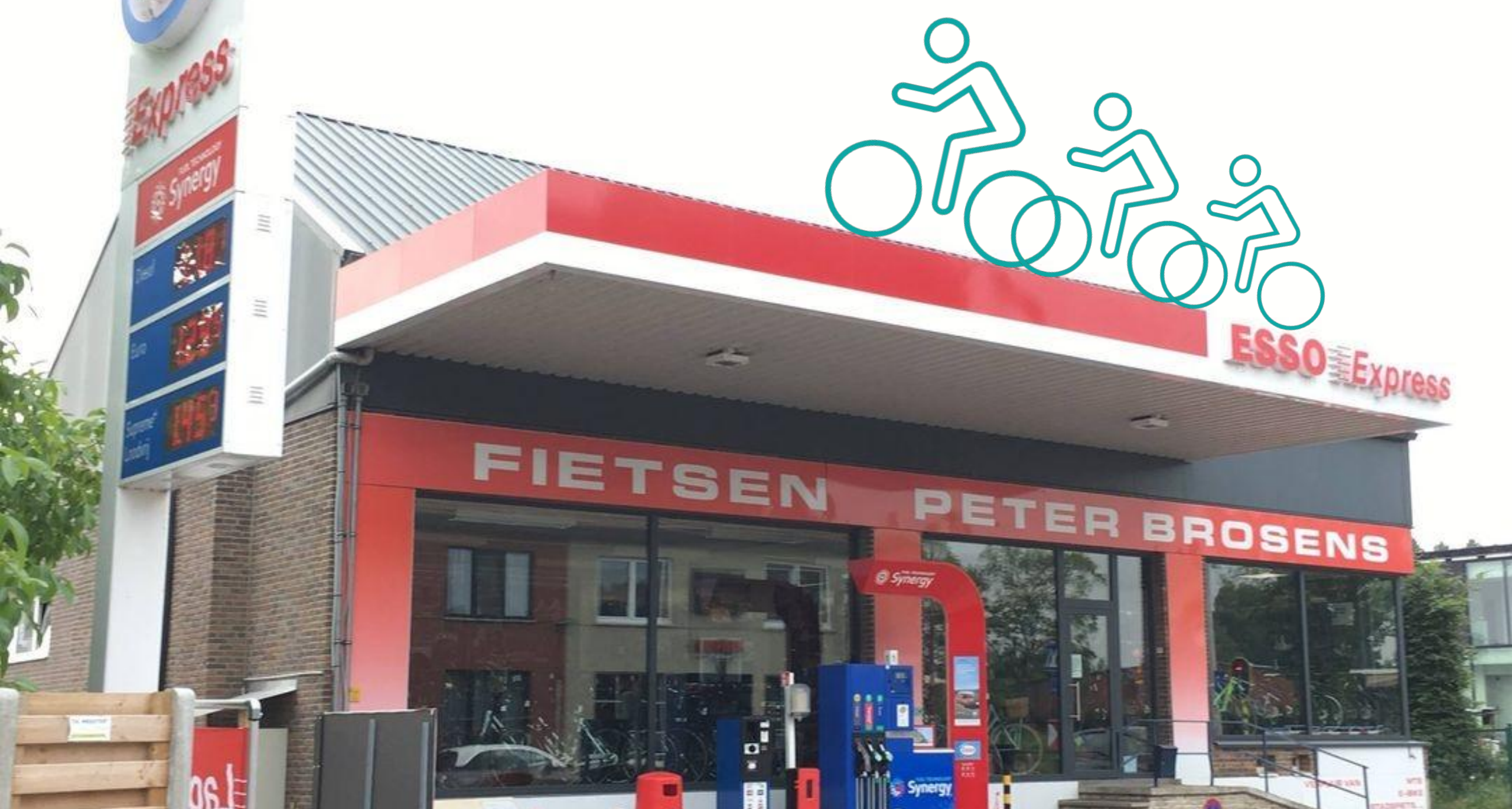
Tankstation of fietswinkel? - Rijkevorsel